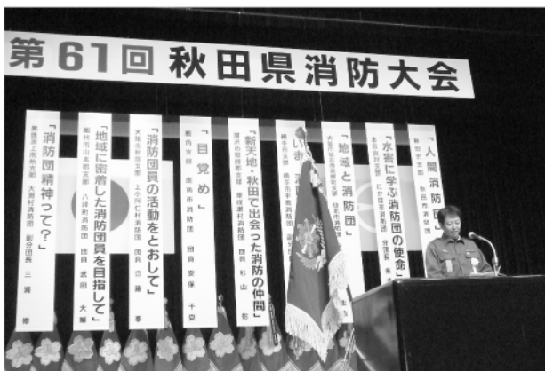
消防団員意見発表会