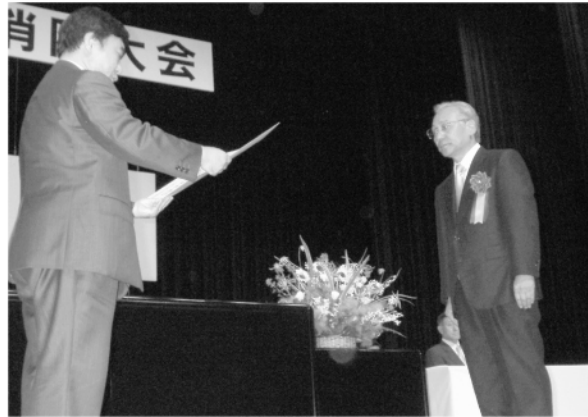
消防功労者知事表彰