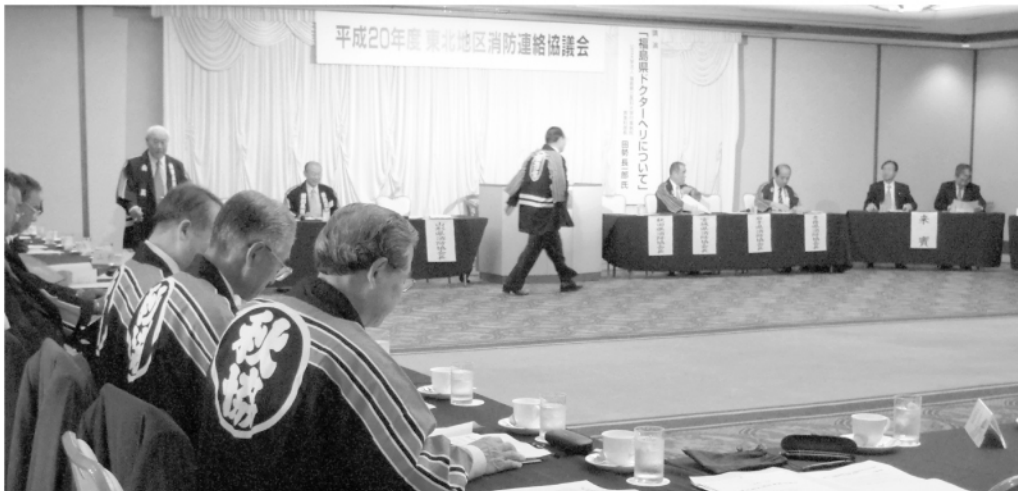
東北地区消防連絡協議会

議題(二) 消防団員の確保対策について 消防団員の確保のため、消防団員の待遇改善や事業所支援などの具体的な環境整備について、国等の措置・指導を要望する。