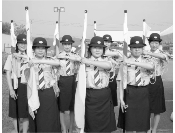
女性消防団員 鹿角市