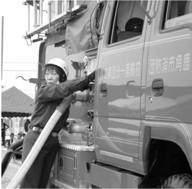
女性消防団員機関員 鹿角市

この日、カラーガード隊は全隊行進の先頭を切つて入場行進。旗を使つての華麗な演技を披露した。また、この大会ではアトラクショントして女性消防団員によるポンプ自動車での揚水訓練も披露した。PRに務めた。